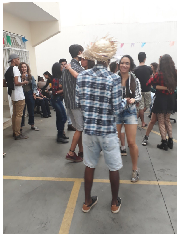
I Festa Junina de Cursinhos Populares de MG

O Instituto Equale deu continuidade ao fortalecimento da rede de cursinhos populares. Durante o trimestre organizamos e realizamos a I Festa Junina dos Cursinhos Populares de MG, importante evento de confraternização entre estudantes e voluntários da rede. A festa foi sediada pelo Equale e contou com participação de 6 cursinhos e mais de sessenta pessoas.