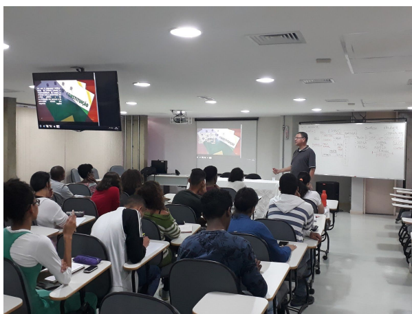
2º aulão dos cursinhos populares: Segurança Pública e Sistema Prisional

Outro ponto marcante foi a construção dos aulões dos cursinhos populares. Esses aulões oferecem oportunidades de abordar temas extracurriculares e de atualidades para os estudantes da Rede de Cursinhos Populares de Minas Gerais. O 1º Aulão da Rede de Cursinhos Populares de MG, ocorreu no dia 21 de agosto, na UFMG, e teve como tema Negritude e Culturas Africanas . O 2º aulão teve como tema Segurança Pública e Sistema Prisional , e foi realizado no dia 15 de setembro, na Fundação João Pinheiro.