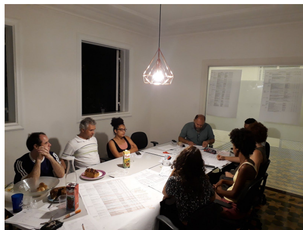
2ª Oficina de Orçamento Público de Mobilidade e Educação

Concluímos também o lançamento de dados atualizados da planilha orçamentária de educação da PBH (hoje publicada em http://bit.ly/PlanilhaOrçamentoBH ). A partir desses dados, iniciamos a construção do Relatório "Execução orçamentária PBH - 2014 ao 2º quadrimestre de 2018 - Secretaria Municipal de Educação". Utilizamos esses estudos para planejar a 1ª Oficina de Orçamento Público de Mobilidade e Educação, em parceria com o Movimento Nossa BH e Mob Cidades. Neste evento, apresentamos os dados do relatório e da tabela. Durante a reunião foram construídos, coletivamente, emendas populares à Lei Orçamentária Anual de 2019, que ainda estão tramitando na Câmara Municipal.